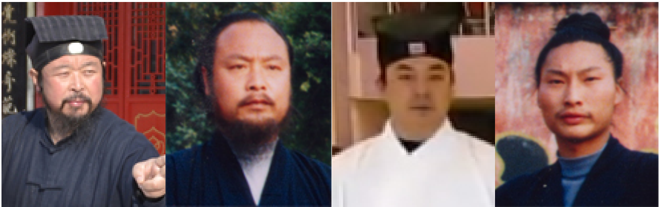
Grand Maître You Xuande