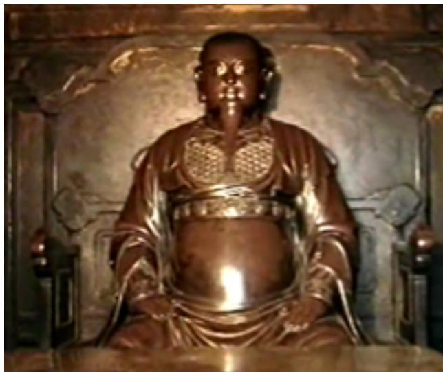
Zhenwu (le « Guerrier véritable ») aussi nommé Xuandi (« l'Empereur sombre »)