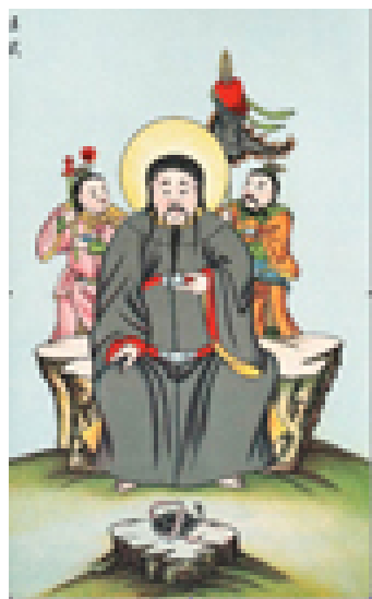
Huen-T'ien-Chang-Ti (l'Empereur sombre)

Recherches sur les superstitions en Chine